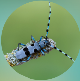
Rosalie des Alpes