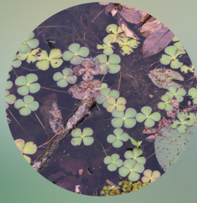
Marsilée à quatre feuilles